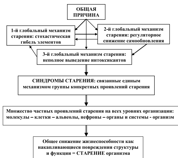
Рис 2. Архитектура проявлений процесса старения для биосистемы – организма

Общей причине старения и главному глобальному механизму старения – стохастической гибели (повреждению) структурных элементов, все живые